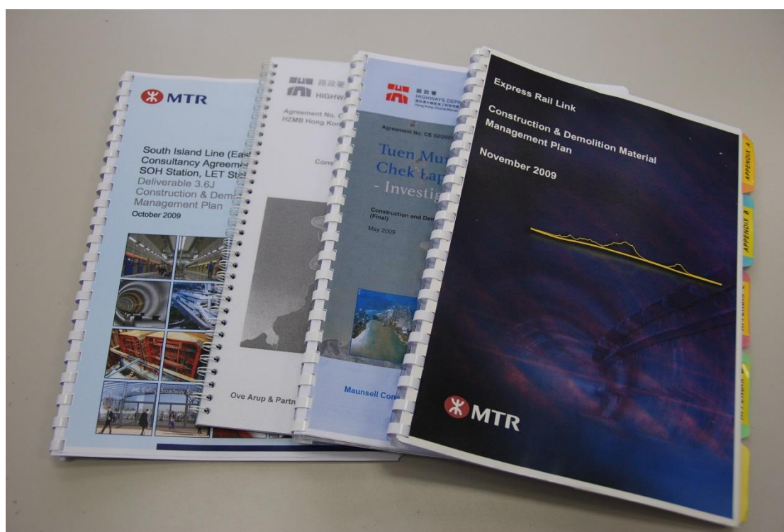
拆建物料管理計劃

為符合「減少、重用和循環再造」原則，由2000年開始，政府已在主要工程項目推行「廢物管理計劃」，工程承建商須制訂及實行「廢物管理計劃」，減少在建造過程中所產生的拆建物料，及於工地實施物料分類以方便以後重用。另外，政府亦於2006年落實「建築廢物處置收費計劃」，為發展商及承建商提供了經濟誘因，減少產生及棄置各種拆建物料。